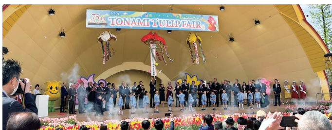
2026となみチューリップフェア(砺波チューリップ公園)