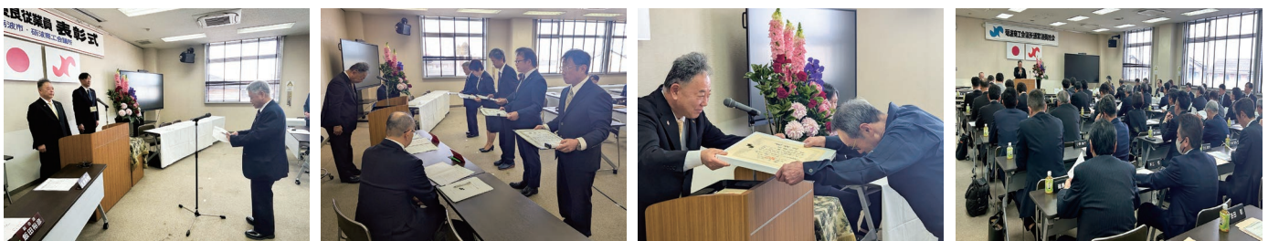
砺波商工会議所通常議員総会、優良会員・優良従業員表彰式(砺波商工会議所2F大ホール)